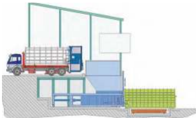
Obrázek 2: Schéma nakládky odpadů s použitím lisovacích kontejnerů